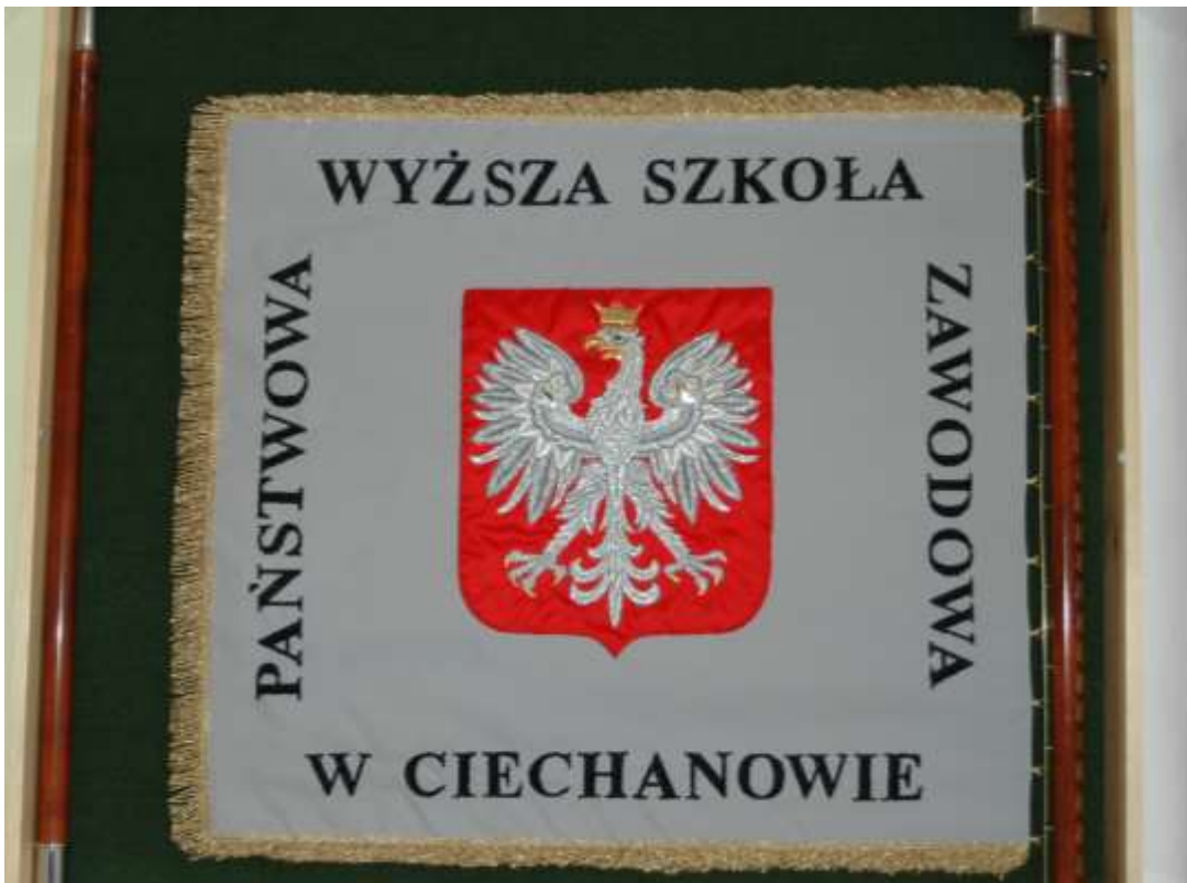
Załącznik nr 1