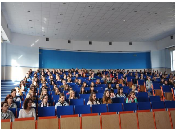
Ryc 1. Aula wykładowa A