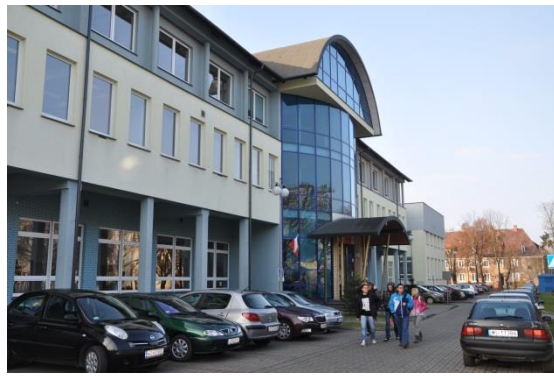
Ryc 4. Budynek główny ul. Narutowicza 9