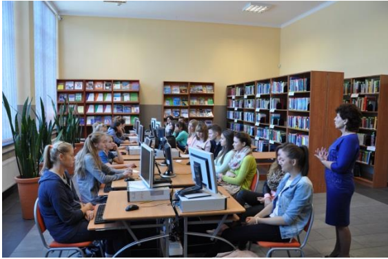
Ryc. 3. Uczelniana biblioteka ul. Narutowicza 9